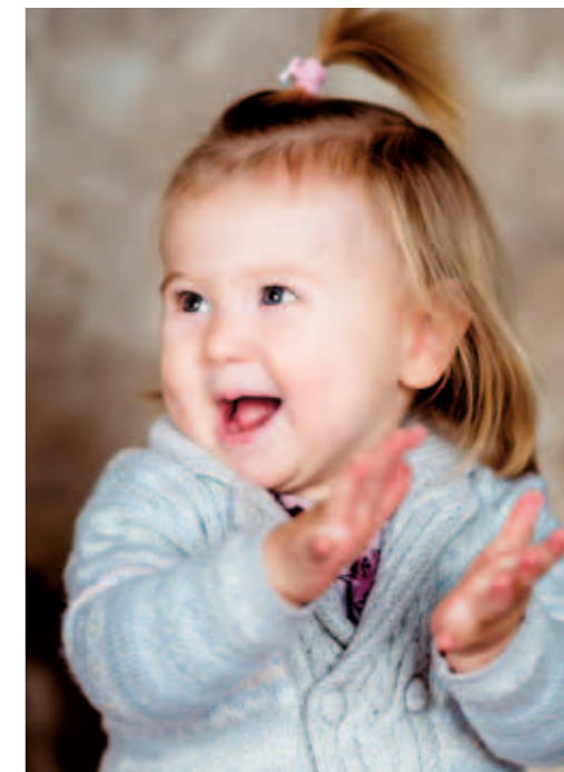
Det lille barns åbenhed, ubekymret og glæde kan minde os om vores sande natur.

- Det svarer selvsagt ikke til at falde hen i sofaen, men vi kender til at afspænde. Det er naturligt for os. Så det er noget, der ligger forud for enhver proces, under enhver teknik, indlejret i enhver reli-