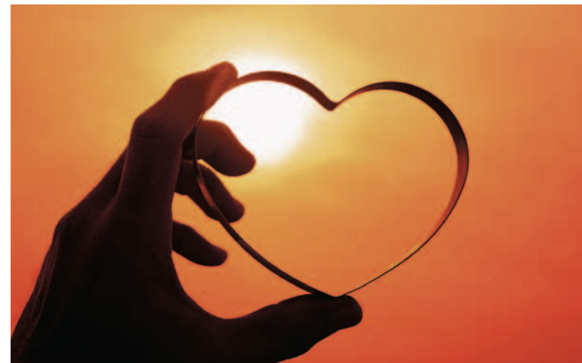
En afspænding, en given slip på tanker og følelser, leder til hjertets blødhed og åbenhed - ren tilstedeværelse.